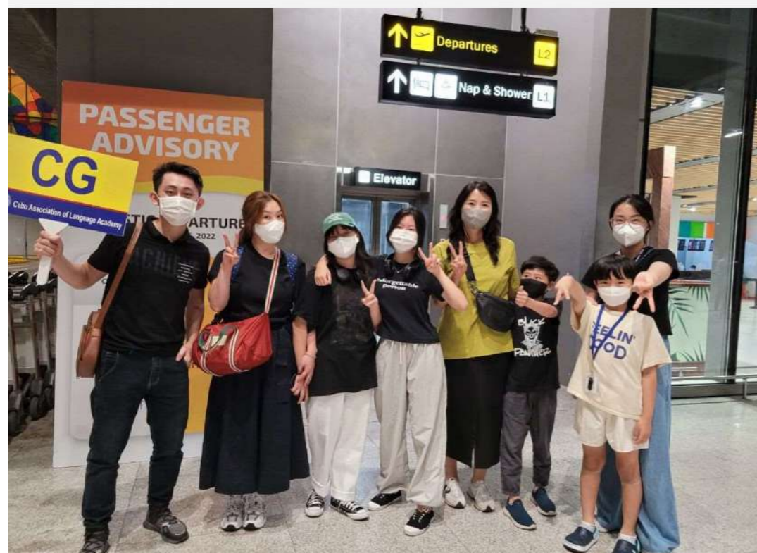
校方經理機場接機