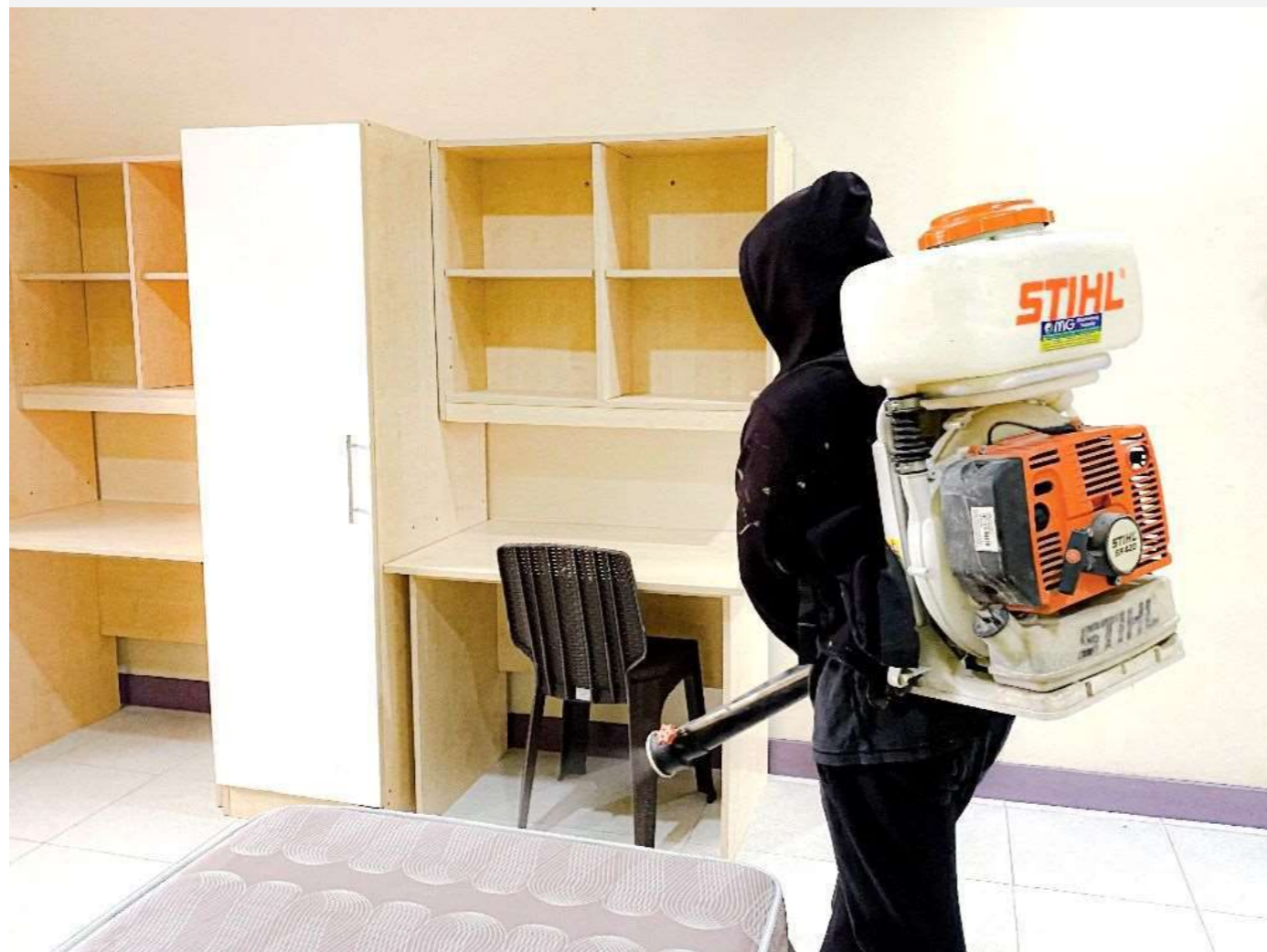
全校定期大規模消毒 內外