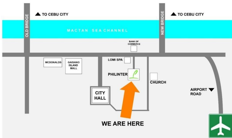
PHILINTER LOCATION MAP MACTAN, CEBU