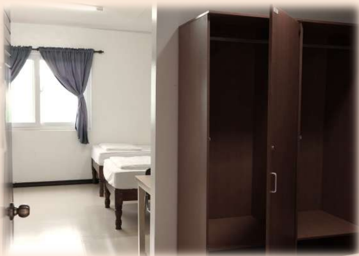
4人房 (平鋪/上下鋪房型隨機分配)