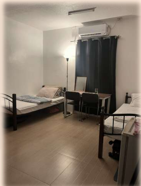
雙人/3人房 (加裝上下鋪)